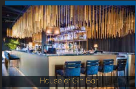
House of Gin Bar

Genießen Sie zudem in der Lobby Lounge einen gepflegten Kaffeeklatsch mit Kuchen aus unserer Pâtisserie & saisonale Gerichte zum Lunch und Dinner.